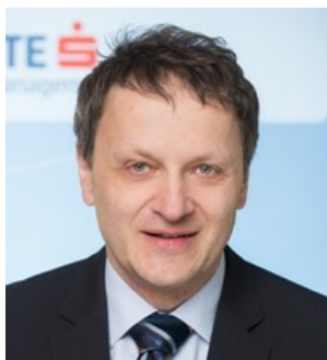
Autor: Anton Hauser Fondsmanger Osteuropa Anleihen

Die tschechische Nationalbank hat sich heute von ihrer vor dreieinhalb Jahren eingeführten Währungsuntergrenze von 27 CZK/EUR verabschiedet. Die Entscheidung kommt nicht unterwartet. Viele Investoren haben im Vorfeld auf diese Aufhebung spekuliert. Die Spekulation auf die Aufhebung ist wohl zur Zeit einer der populärsten Trades. Die tschechische Krone hat wie erwartet gegenüber dem Euro etwas zulegen können. Kurzfristig wird die Währung etwas stärker schwanken, weil noch viele spekulative Gelder involviert sind. Langfristig gehe ich davon aus, dass die tschechische Krone aufgrund der sehr guten fundamentalen Entwicklung