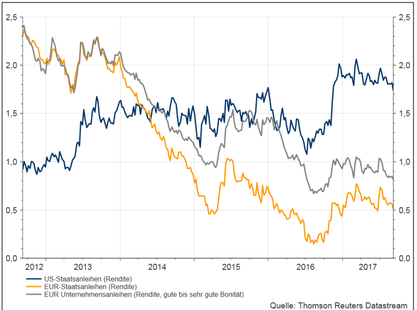
Rendite-Entwicklung von europäischen Hochzinsanleihen im Vergleich zu globalen Hochzinsanleihen und Unternehmensanleihen von Schwellenländern (08/2012-08/2017)